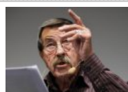
El premio Nobel Günter Grass dice adiós a su obra narrativa