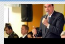
Piden mayor compromiso de autoridades para atender población con discapacidad