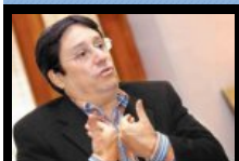
No voy caer en la trampa del M-19 sobre un complot contra Petro: Francisco Santos