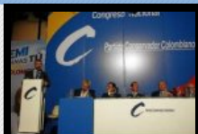
Conservadores siguen divididos por candidatura presidencial