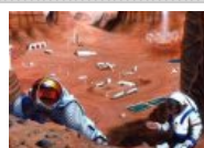
"El reto será grande; no será fácil vivir en Marte", dice colombiano preseleccionado